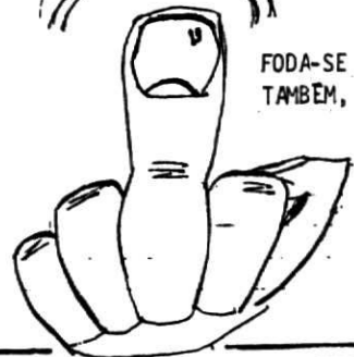
FODA-SE VOCE TAMBEM, MAX.

Adoro cheiro de buceta. Fodam-se nova- mente.